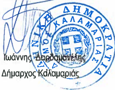
Ιωάννης Δαρδανανέλης Δήμαρχος Καλαμαριάς