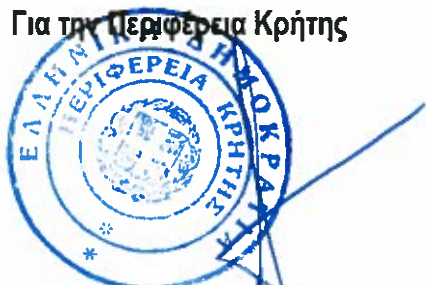
Σταύρος Αρναουτάκης Περιφερειάρχης Κρήτης