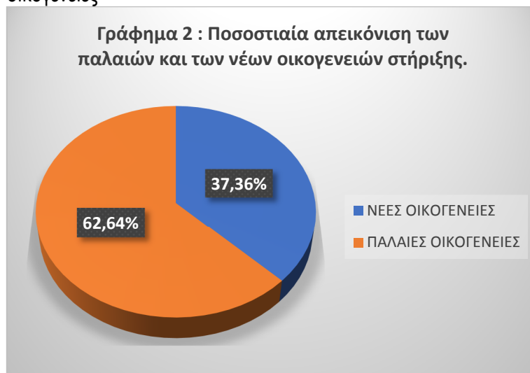
Γράφημα 2 : Ποσοστιαία απεικόνιση των παλαιών και των νέων οικογενειών στήριξης.