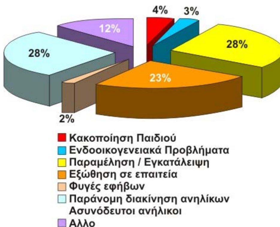
Γράφημα 3: Ποσοστιαία απεικόνιση επιτόπιων παρεμβάσεων ανά λόγο παρέμβασης.

Για την εξυπηρέτηση των περιστατικών επιτόπιας παρέμβασης υπήρξε συνεργασία με τους ακόλουθους φορείς: