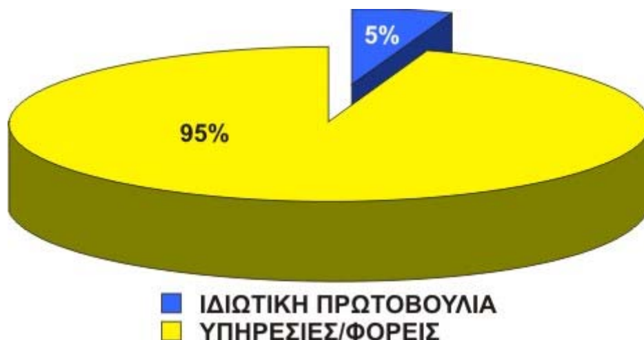
Γράφημα 1: Σχηματική απεικόνιση προέλευσης παραπομπών φιλοξενίας

Το σύνολο των αιτημάτων αφορούσε σε 293 παιδιά.