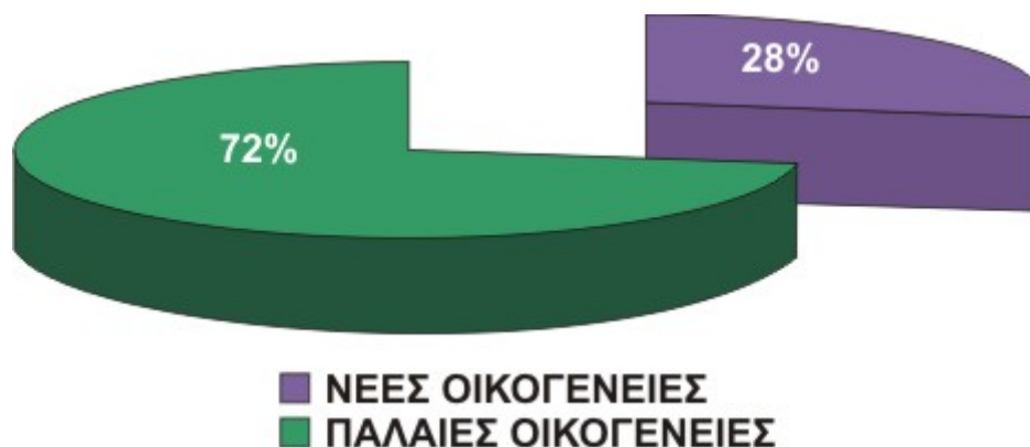
Γράφημα 2: Ποσοστιαία απεικόνιση των παλαιών και νέων οικογενειών στήριξης