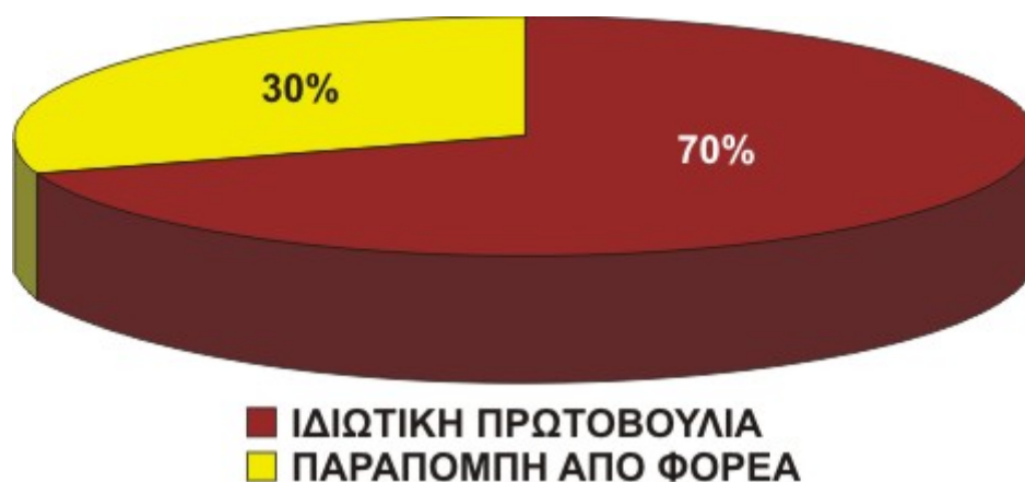
Γράφημα 1: Σχηματική ποσοστιαία απεικόνιση του τρόπου προσέλευσης των ιατρικών περιστατικών

Οι κυριότερες παθήσεις που αναφέρθηκαν ήταν: